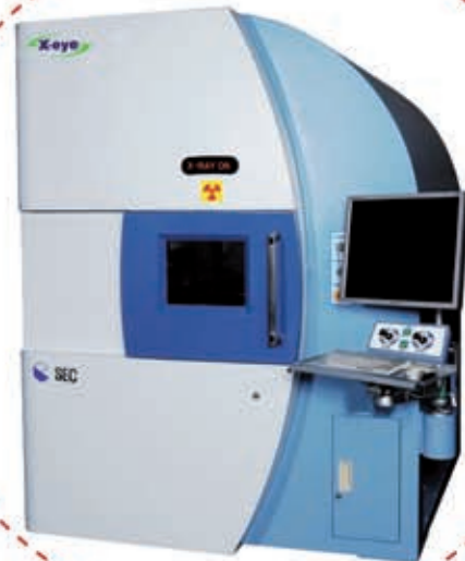
X-Eye SF Series

Complétée par un système de tomographie sur station déportée qui permet la reconstitution tridimensionnelle et la pénétration au cœur de la matière, la machine SEC est l'outil polyvalent par excellence.